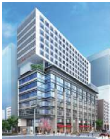
三井ガーデンホテル日本橋プレミア（1階・9階～15階部分）（完成予想パース）

三井不動産グループは、今後も首都圏や全国の主要都市において積極的に新規展開を行ってまいります。