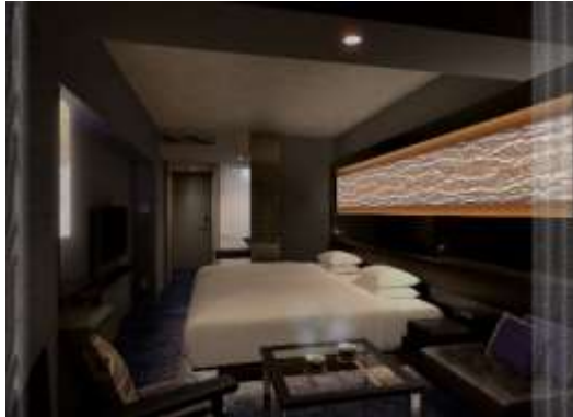
客室（スーペリアツイン）

また、ロビー階（9階）には、日本文化の象徴として宿泊者専用の「Japanese Bath（大浴場）」を設け、宿泊客へ癒しを提供いたします。