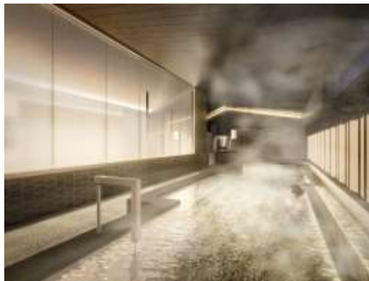
9階 Japanese Bath（大浴場）