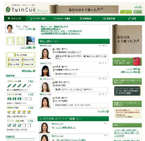
▲マイページのトップ画面のイメージ