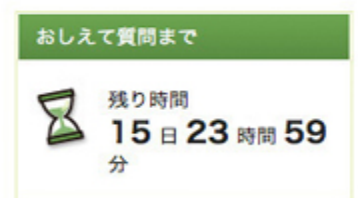
▲残り時間を砂時計で表示