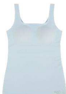
<G028 T-Top2> ライトブルー

一枚で着られるカップ付きインナーも好評です。吸水速乾機能と汗に対する消臭機能があります。