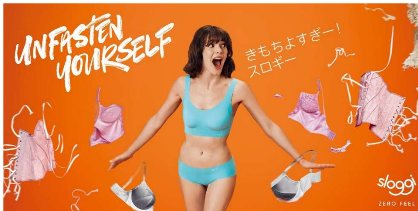
世界共通クリエイティブで 2018 年春夏キャンペーンをローンチ

“一人ひとりの自信を高める会社”トリンプ・インターナショナル・ジャパン株式会社(本社:東京都中央区築地 5-6-4、代表取締役社長:ヴァンサン・ネリアス)では、“毎日の暮らしをもっと楽しくする”がコンセプトのブランド「sloggi(スロギー)」ブランドとして日本で独自に開発し、2013 年の販売開始以来、シリーズ累計 400 万枚を超える大ヒット商品となった「sloggi ZERO FEEL(スロギー ゼロ フィール)」の グローバル市場での販売が決定 しました。発売を記念して、2018 年 3 月 8 日の国際女性デーに、ヨーロッパ・アジアなど 世界約 40 カ国で 2018 年春夏キャンペーンがローンチ します(日本国内のキャンペーンローンチは 3 月 22 日)。