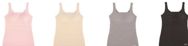
ベビーピンク ウォームベージュ ココアブラウン ブラック