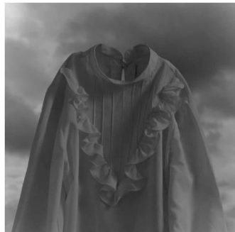
オノデラユキ「古着のポートレート No.10」 ©YUKI ONODERA