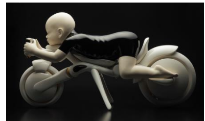
林 茂樹「OO-I」(日本橋会場) ©SIGEKI HAYASHI