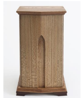
安藤和夫「神代楡厨子ゴシック 2018」