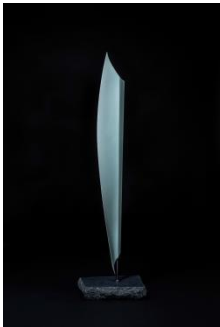
深見陶治 「孤」Ko -Sprendid Isolation-

井川 健 (漆芸) 伊庭 靖子 (絵画) オノデラユキ (写真) 林 茂樹 (立体) 深見 陶治 (陶芸) 福本 潮子 (染色) 三島 喜美代 (立体) 宮崎 進 (絵画) ※井上 有一 (書) ※は故人