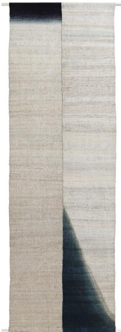
福本潮子「東北-IV」 (日本橋会場)