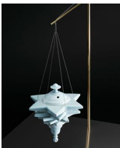
八木 明 「青白磁釣香炉」