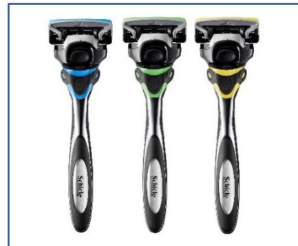
肌タイプ別ジェルに合わせたカラーリング