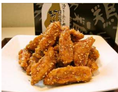
努努鶏手羽中 250g 1,080円