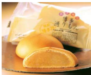
博多通りもん 6個 980円