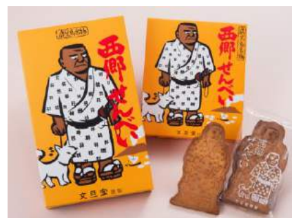
西郷せんべい 8枚入り 540円