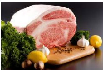
熊本産黒毛和牛「和王」

ふくや「風」セット(味の明太子/360g、数の子明太子・いか明太子/各 140g) × 20 名様