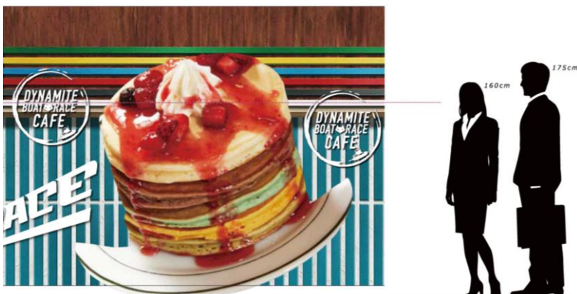
※立体物の大きさイメージ