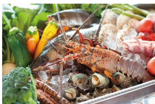
新年にふさわしい豪華な食材を使った料理