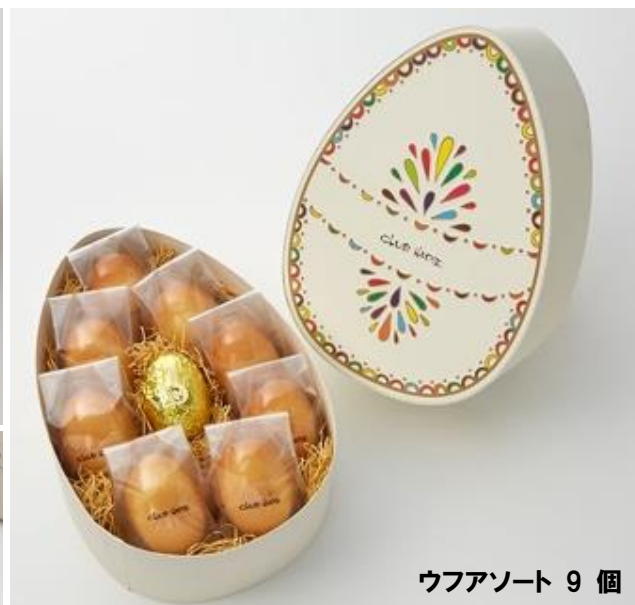
ウフアソート 9 個