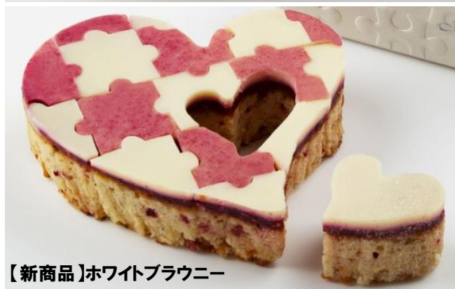
【新商品】ホワイトブラウニー