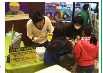
地域防災情報コーナー

防災マップの配布に加えて、自宅に備えておきたい防災グッズの紹介などをクイズ形式で行います。