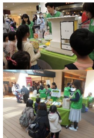
前回実施の様子 上)家具転倒防止 下)災害時に対応できる食材選び