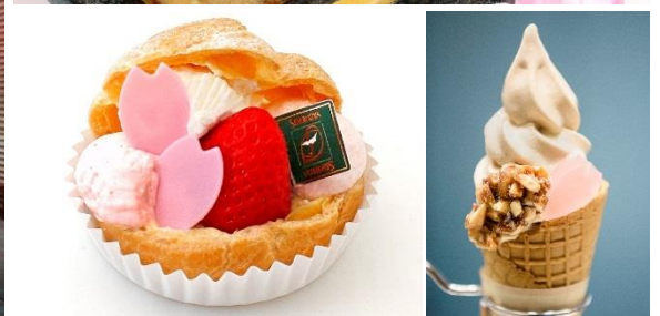
<期間限定の桜メニュー「日本橋桜メニューウォーク」>