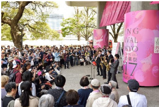
<桜の街の音楽会 in 日本橋>