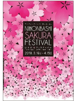
日本橋 桜フェスティバル メインビジュアル

協 賛：コレド日本橋、コレド室町1～3、東京ステーションシティ運営協議会、 東京建物株式会社、日本橋木屋、日本橋高島屋、日本土地建物株式会社、 日本橋三井タワー、日本橋三越本店、野村不動産株式会社、 マンダリン オリエンタル 東京、三菱地所株式会社、安田不動産株式会社