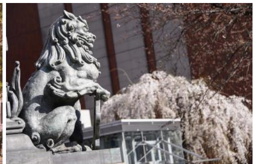
<期間中、ソメイヨシノや桜ライトアップなど街全体が桜色に染まる>

※詳細は、3月上旬に配信する詳細資料や2月下旬公開予定の公式サイトにてお届けします。