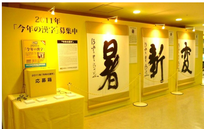
2011年に東京タワーに設けられた「今年の漢字」展示コーナーの様子