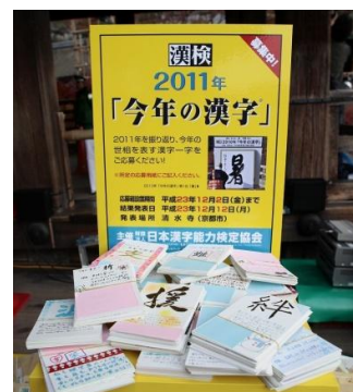
2011年の応募箱とはがき応募の様子

03-5744-7678 ※この番号は「今年の漢字」の応募専用ダイヤルです。 ※応募期間のみ有効です。読み取れない場合は無効となりますので、応募内容は、はっきり・濃くお書きください。