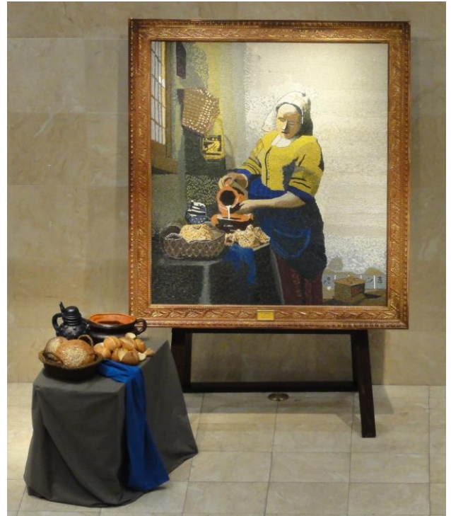
↑写真は、↑2012年の作品「牛乳を注ぐ女」