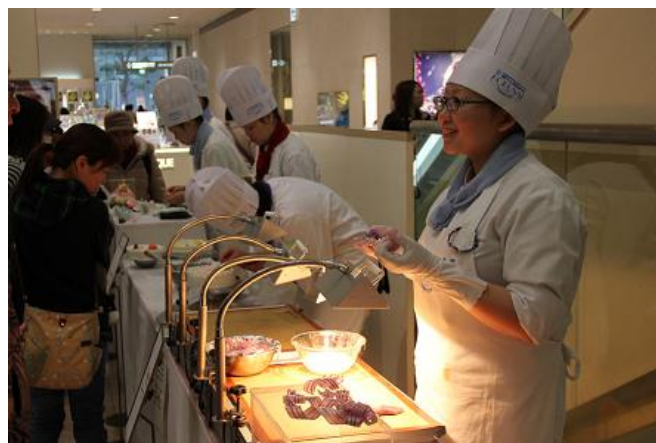
↑写真は、2012年1階特設会場でのデモンストレーション風景