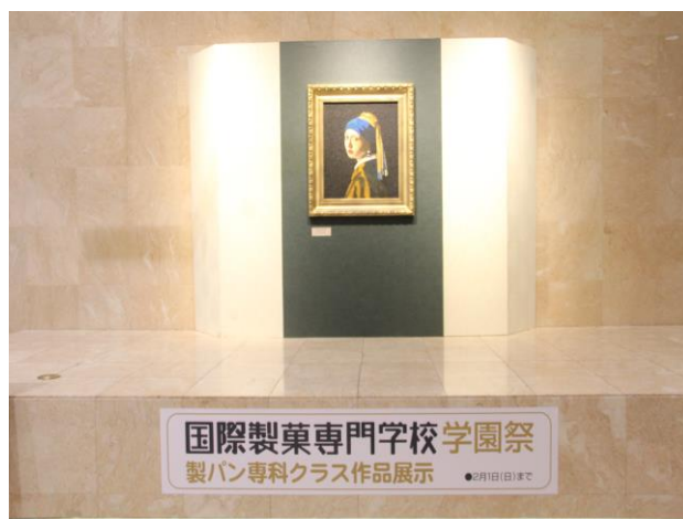
↑写真は、2015年の作品『真珠の耳飾りの少女』