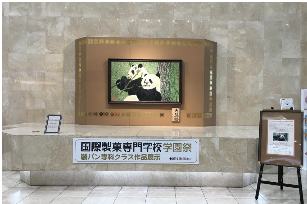
↑写真は、2017年の作品「日中友好」