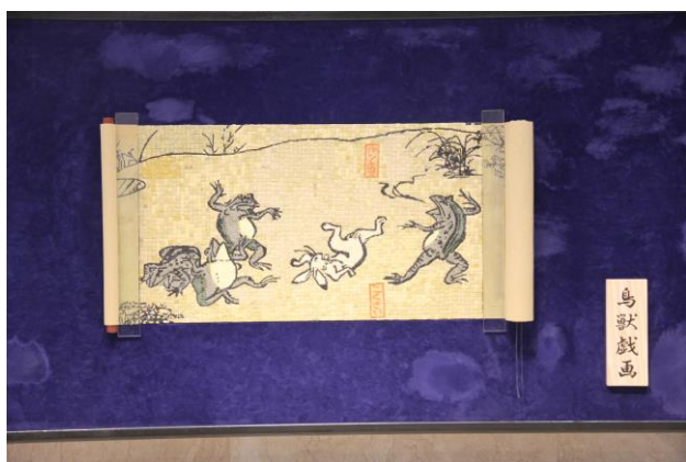
↑写真は、2016年の作品「鳥獣戯画」