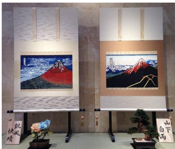
↑写真は、2014年の作品「凱風快晴」と「山下白雨」※手前の松などもパンです