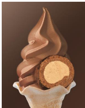
《モンシェール》 堂島プリンスロール on ソフトクリーム (ショコラ) (1個) 501円

ショコラ風味のソフトクリームに ハート型チョコレートなどでデコレーションした限定アイテム♪