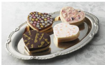
《ノリエット》クール ジャポン (3種、各2枚) 2,700円 数々の名店を経たオーナーシェフ・ 永井紀之氏のアレンジ。ハートの もなかの中にナッツやフルーツが。 チョコとの相性の良い、シェフ こだわりの3種の組み合わせ。