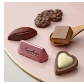
《c7h8n4o2》バルベロー バレンタイン限定詰合せ (5個入) 1,512円 自由が丘のチョコレート専門セレクトショップ から北イタリアの老舗「バルベロー」伝統 の味をセレクト。ハートの形はこの時期だけ。