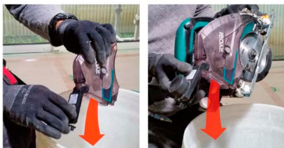
スムーズなゴミ捨てが可能。左：取り外し時 右：装着時

ゴミ捨ては、ダストボックスを取り外しても装着したままでも可能。排出カバーを開けるだけで簡単に捨てることができます。