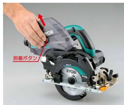
脱着ボタンを押すだけでワンタッチで取り外し可能。取り付けも簡単です。

ワンタッチで脱着可能なダストボックスによって、作業現場の状況や用途に合わせた使い方が可能。切粉を飛散させたくない現場では集じん丸ノコとして、飛散を気にしなくてよい現場では通常の丸ノコとして使用できます。