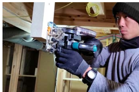
ハイパワーの充電式で作業効率を高めます。

高出力の18V電池で切断スピードと作業量が向上。当社従来品に比べ切断スピードは約13%、作業量は約53%アップを実現しました。