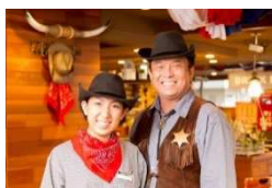
カウボーイ・カウガールが明るくお出迎え

今後も質の高い肉料理や充実したサラダバーを提供し、我が家のホームパーティーにお招きしたようなサービスで、地域の皆様に楽しんでいただけるレストランとなるよう努めてまいります。