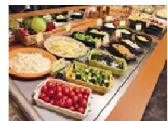
20 種類以上楽しめるサラダバー