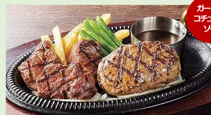
みすじ&ハンバーグコンボ

【カットステーキ 40g×3・ソーセージ・チキングリル】 2,389 円 (税込 2,580 円) / サラダバー付