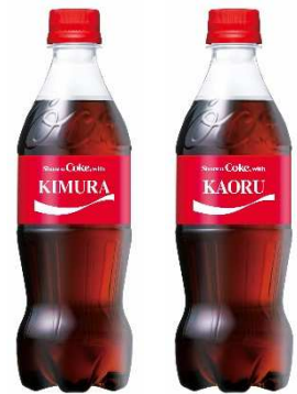
ネームボトルイメージ