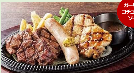
みすじミックスコンボ

【カットステーキ 40g×3・ソーセージ・チキングリル】 2,389 円 (税込 2,580 円) / サラダバー付