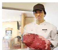
肉は、コックが 1 枚ずつ丁寧に店内でカット