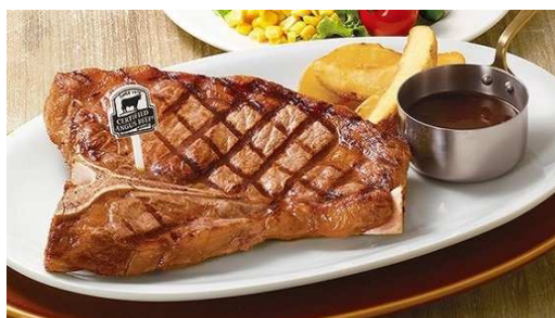
Tボーンステーキ ※画像は420g

今回登場する「Tボーンステーキ」は、甘味のあるサーロインと赤み肉のヒレが一度に楽しめる、ステーキ好きにはたまらない一品です。また、旨味たっぷりの骨付きサーロイン「Lボーンステーキ」もご用意しました。更に、希少部位である“みすじ”を使用した「みすじステーキ」も販売します。サーロインやヒレとは異なり、あっさりとしながら旨味のある肉質をお楽しみいただけます。さらに、ソーセージとチキングリルも一緒になった「みすじミックスコンボ」、粗挽きハンバーグも味わえる「みすじ&ハンバーグコンボ」も期間限定で登場。「カウボーイ家族」では、米国農務省（USDA）の認定より厳しい基準で選ばれ、アンガス牛の中でも認定が2割程の高品質な「サーティファイド・アンガス・ビーフ®（CAB）」を使用しています。ステーキにあわせ、スパークリングワイン、赤・白ワインなどのアルコールも充実させました。