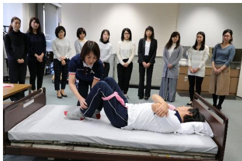
「健康生活支援講習支援員養成講習」 を大京アステージ社員が受講

今後は、大京アステージと日赤が協力することにより、「健康生活支援講習」を活用した「地域包括ケアシステム」の推進に貢献するのはもちろんのこと、大京アステージにおいては、習得した知識等を生かした「管理サービスの質の向上」や「新商品・新サービスの開発・提供」を目指してまいります。