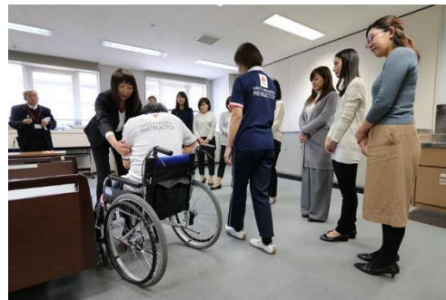
大京アステージ社員が実際に ベッドでの起き上がり介助を実践