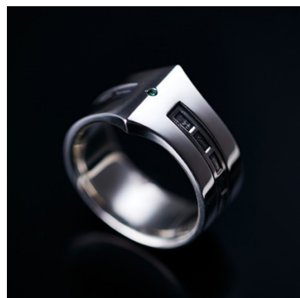
PUERTA DEL SOL(西武池袋本店先行販売) ウルトラセブンリング TYPE-1(エメラルド) 19,000円(税抜)