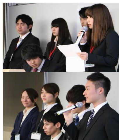
↑ 前回の最終報告会の様子