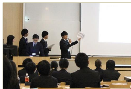
↑ 2016年ゼミ大会の様子