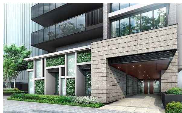
「ライオンズ桑名駅前グランフォート」建物完成予想図