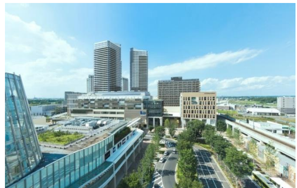
「柏の葉キャンパス」駅付近から見た本物件（超高層棟の左側） <外観完成予想 CG>

なお、本物件賃貸住宅の契約者様には、お子様の入園が保証される予定（期間・受入れ人数に制限があります (※) ）で、入居様の子育てを応援するマンションとなっています。