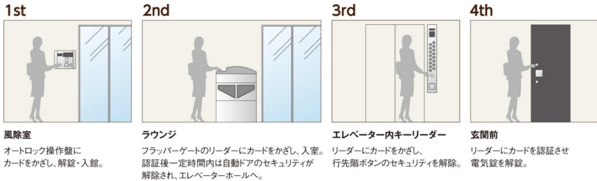
<セキュリティシステム概念図>

また、本物件では、物件の入り口から自宅玄関まで、オートロックやフラッパーゲートなどで四重に守られた強固なセキュリティを実現しました。いずれのロックも入居者はカードをかざすだけで解除可能です。