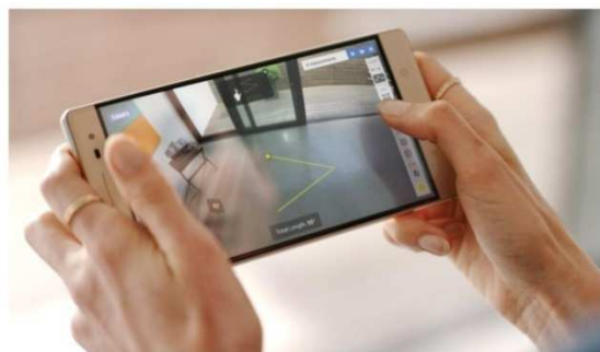
物件の大きさを測定も可能

「Phab 2 Pro」の紹介 https://www3.lenovo.com/jp/ja/tango/