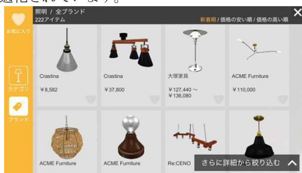
設置したい家具・照明などを選択

今回のARホームステージングサービス向けに提供される「RoomCo AR ホームステージング」は、Google社の空間認識技術「Tango」を用いた部屋の形状認識と記憶の機能を備えており、またコーディネートに必要な不可欠なグリーンや雑貨などの3Dデータを新たに追加収録するなど、ホームステージング用途に最適化されています。