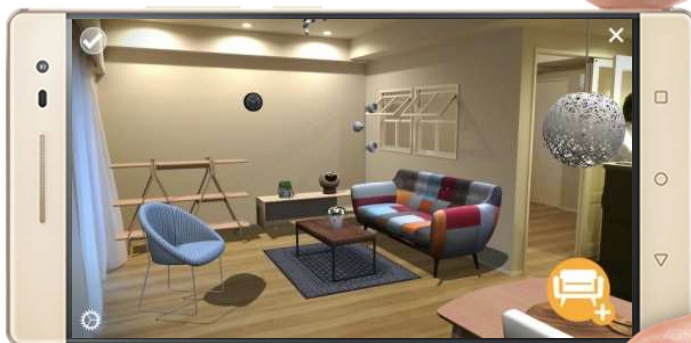
Phab 2 Pro の画面イメージ