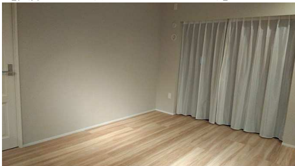
【実際の室内（リビングダイニング）】

ARホームステージングサービスは、何もない実際の室内で家具や小物でコーディネートした状態を、自由に歩き回りながら自分の好きな場所・好きな角度から確認いただけるものです。室内での生活イメージがしやすくなります。