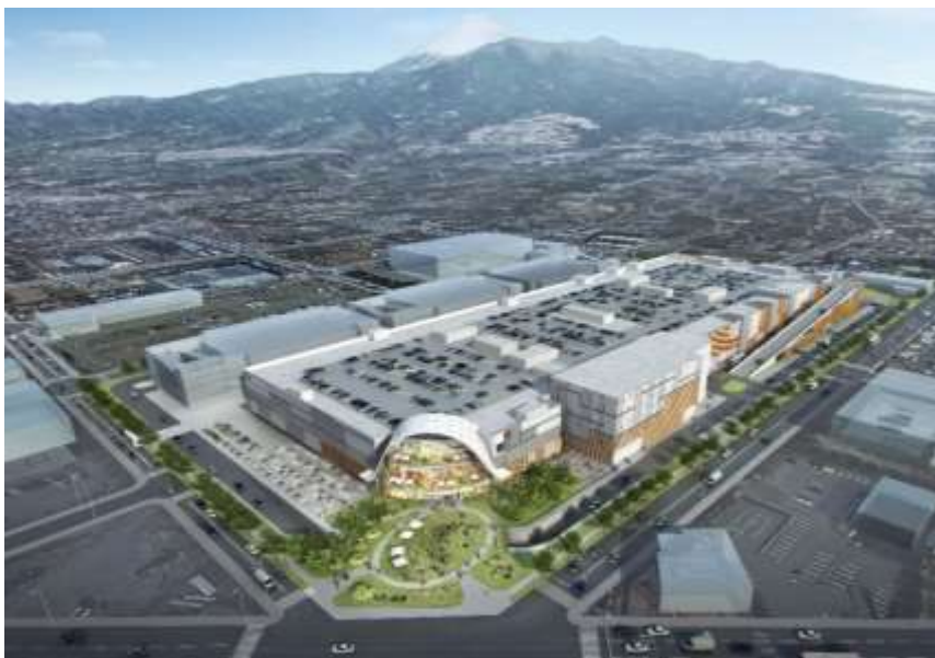
「(仮称) 三井ショッピングパーク ららぽーと沼津」イメージ