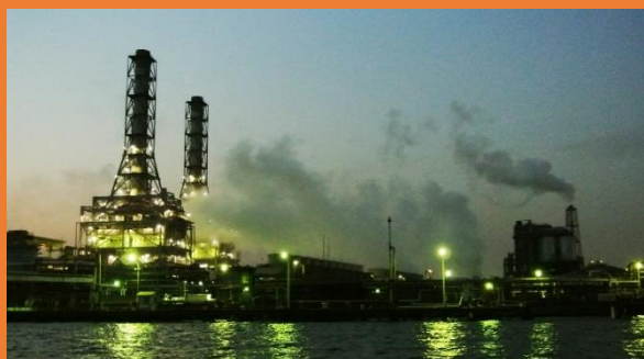
いま大人気の工場夜景ツアー