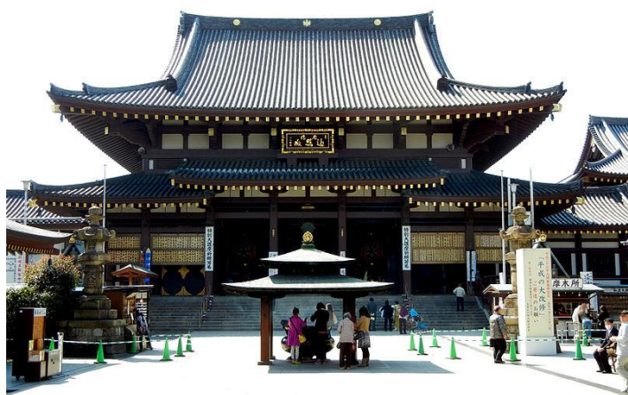
お正月には大勢の参拝客で賑わう川崎大師