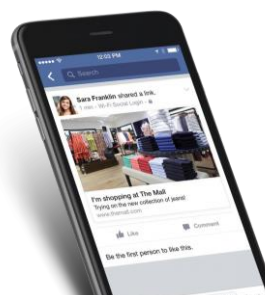
<Facebook チェックイン画面>