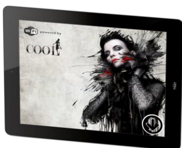
<スプラッシュページ>

加えて、Wi-Fi接続時に表示させるスプラッシュページ（全画面にイメージ画像を表示するページ）や、認証画面を兼ねた店舗情報ページを作成可能です。用意されているテンプレートに画像や文字を入れるだけで、ブランドイメージに沿ったページを簡単に作成可能で、新商品情報やキャンペーン情報等をWi-Fiサービス利用者へ提供することができます。