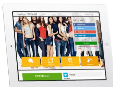
<認証画面を兼ねた店舗情報ページ>