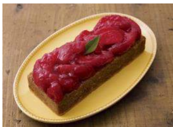
【テラ・セゾン】 赤～いりんごの焼きガトー