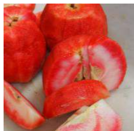
【赤～いりんご】 小つぶで果肉まで赤い