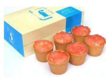
【フロマージュ・テラ】 とろとろ焼きカップチーズ 赤～いりんご