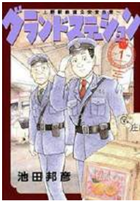
漫画「グランドステーション」

11月18日には、池田先生による制作実演会を開催。先生が実際にイラストを制作される様子をご覧ください。また当日は、著書「机の上の小さな鉄道レイアウト作り」をご購入のお客さまに先生が直筆サインを致します。