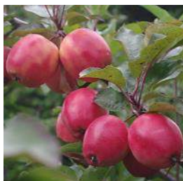
【赤～いりんご】 実だけでなく葉や茎も真っ赤

今回のプラス東北フェアの目玉である東北の紅であふれたりんごスイーツ。中でもテラ・セゾンの「赤～いりんごの焼きガトー」とフロマージュ・テラの「東北りんごを使用したとろとろ焼きカップチーズ」に使われているりんごには秘密が...なんと皮だけでなく中まで赤いりんごを使っています。