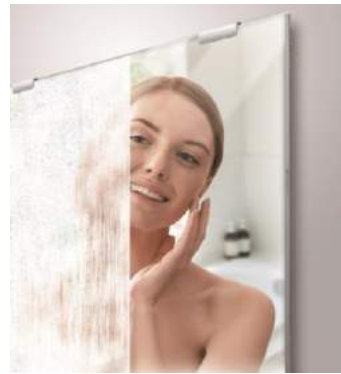
使用前と使用後のイメージ画像

入浴時、何度シャワーで洗い流してもすぐに曇って見えなくなってしまうお風呂の鏡。クレンジングや髭剃りをしたくても曇った鏡では何も見えず、困っている方も多いのでは。