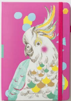
DANCING BIRD (2946)

鮮やかな色の組み合わせにキュートなモ チーフ。持ち運べる身近なアートとして、ち よっぴり誇らしい気持ちにさせてくれます。 一息つくときにじっと見つめたい、あな たの自慢の 1 冊に。