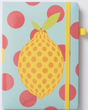
LEMON DROP (2948)