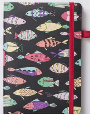
NIGHT SEA (2942)