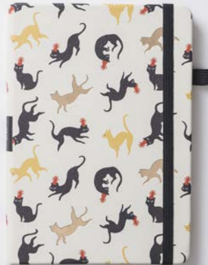
PARTY CAT (2944)