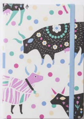
HAPPY COW (2941)