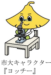
市大キャラクター 『ヨッチー』