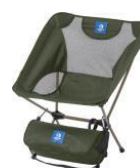
・折りたたみチェア