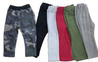
・カットソーパンツ