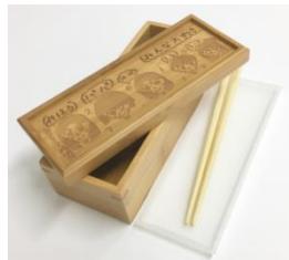
・竹製弁当箱（竹箸付き） 〈ファンファン/レザー絵付け加工可〉