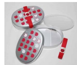
・アルミ製弁当箱 〈スマイリッシュ〉