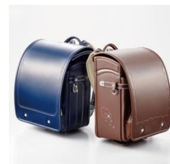
・グランリボン （別売リボン交換可）