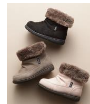
・アシックス SUKU2<スクスク>