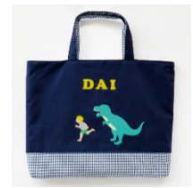
・レッスンバッグ (アプリケでカスタマイズ)