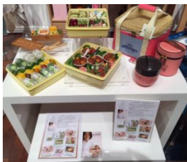
・保育所用小サイズ弁当/ 運動会見せ弁/塾弁 等