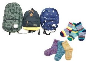
・リュックサック/ソックス