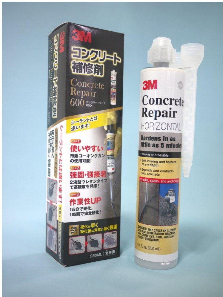
3M™ コンクリート補修剤 コンクリートリペア600