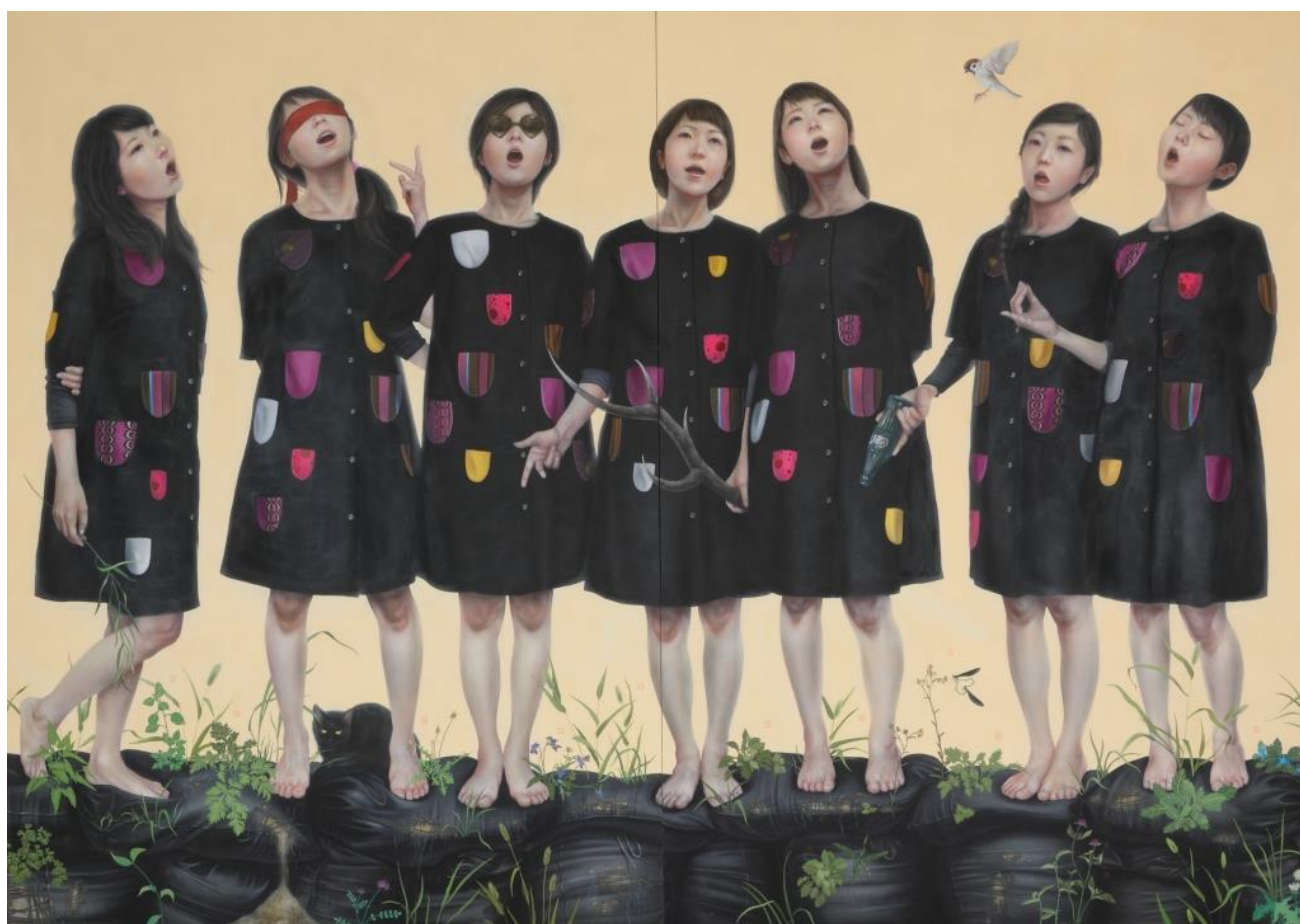
「斉唱〜神7の唄〜」2017年 280×390cm 高知麻紙、アクリル絵具、水干絵具、墨

■会期・会場:9月6日(水)~9月25日(月) 日本橋高島屋6階美術画廊X 10月4日(水)~10月16日(月) 新宿高島屋10階美術画廊