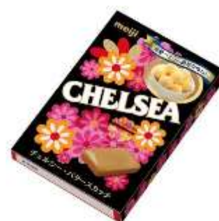
「チェルシー バタースカッチ」の箱

「チェルシー バタースカッチ」の箱をイメージした特製パッケージ(Sサイズのみ、数量限定)でご提供いたします。