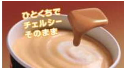
NA： 一口でチェルシーそのまま