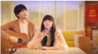
秦 基博： ♪ほら〜