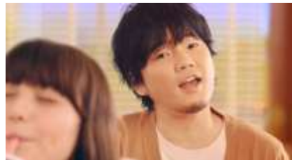
秦 基博： ♪マックシェイク チェルシ〜