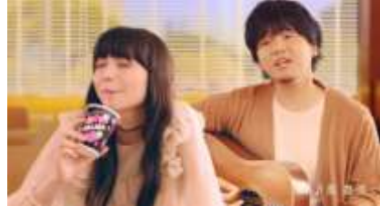
秦 基博： ♪もひと〜つ〜チェルシ〜