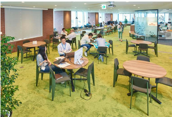
オフィスの中心部に位置する「パーク」

第30回目となる今回は、応募総数129件の中から、16のオフィスが「ニューオフィス推進賞」に選出され、マース ジャパン/ロイヤルカナン ジャポン 東京本社は、その中でも「クリエイティブ・オフィス賞」を受賞しました。