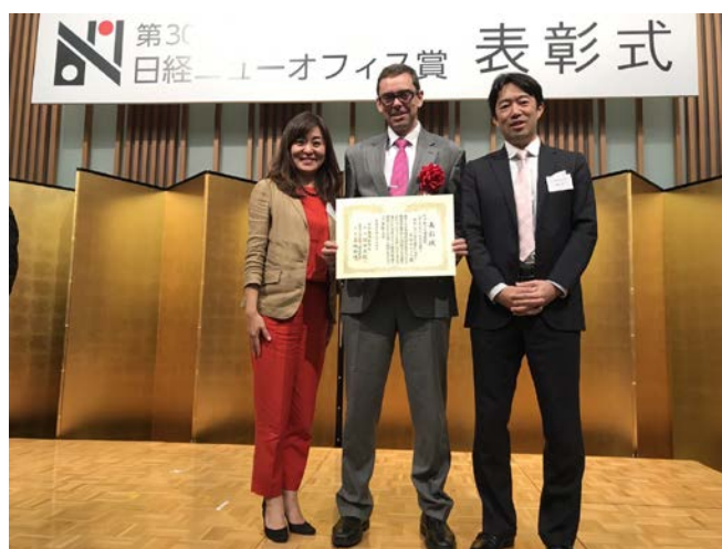
8 月 29 日に開催された表彰式の様子