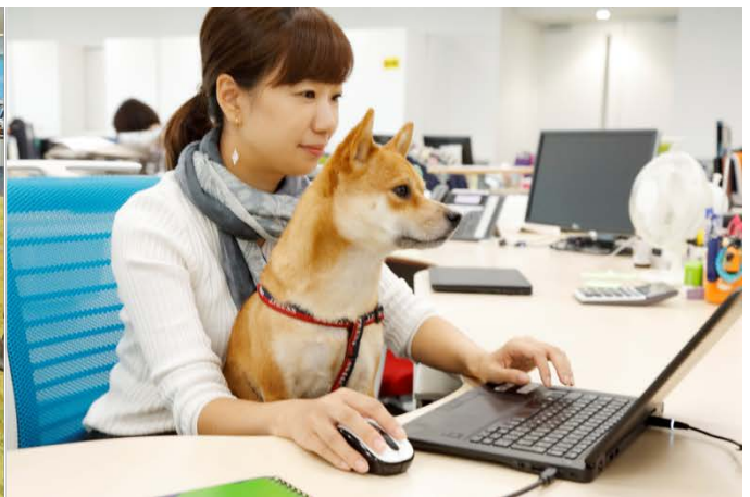
ペットと同伴出勤のできるオフィス

今後も、マース ジャパンとロイヤルカナン ジャポンは、両社のビジネスの違いを尊重しながらも、「ウェルビーイング」、「ワンチーム」、「ペットフレンドリー」のコンセプトを取り入れた東京本社オフィスで、共通の企業文化を育ててまいります。