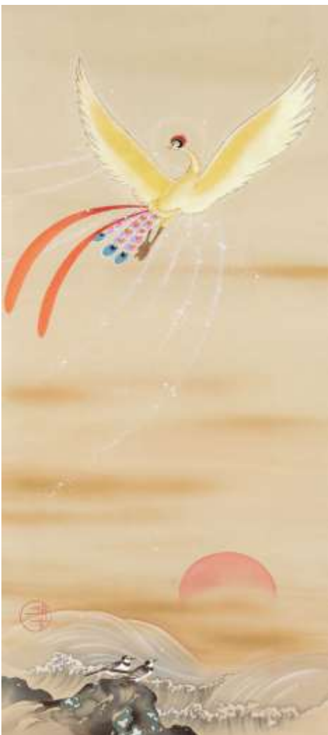
〈火の鳥×旭日に波濤〉