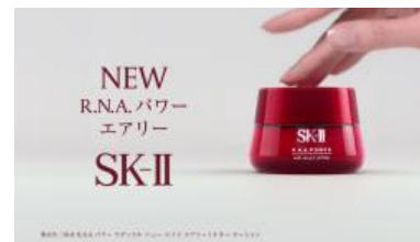
SUPER: 販売名:SK-II R.N.A. パワー ラディカル ニュー エイジ エアリー ミルキー ローション