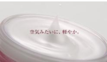
Na: 「空気みたいに、軽やか。」