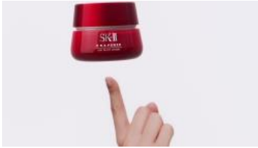
Na: 「R.N.A.パワー エアリー」