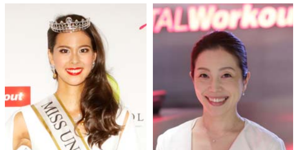
▲ 2017 ミス・ユニバース・ジャパン 阿部桃子