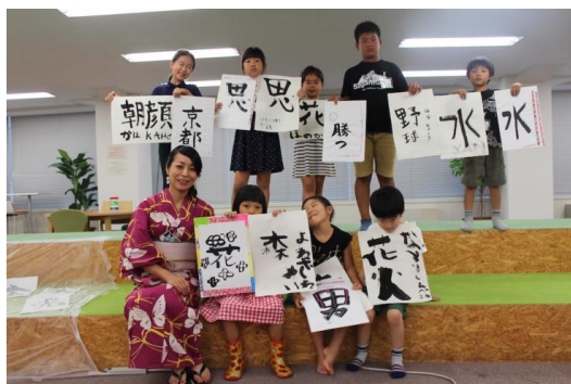
小学校の長期休み中の学童サービス