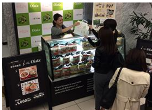
Work-Life Bridge x Oisix 時短料理キット販売イベント