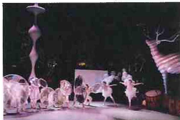
東京キャラバン in 六本木（2016年）

東京都及びアーツカウンシル東京（公益財団法人東京都歴史文化財団）は、京都文化カプロジェクト実行委員会（京都府、京都市、京都商工会議所等）とともに「東京キャラバン in 京都」を計画・実施していきます。東京のみならず、日本全国の皆様に「東京キャラバン」に足を運んでいただき、新しいパフォーマンスが生まれる瞬間と一緒に体験いただきながら、「東京キャラバン」との一期一会が日本中をつなぎ、さらには東京2020オリンピック・パラリンピックに向け、日本が文化の力でひとつになる、大きなムーブメントとなっていくことを願っています。