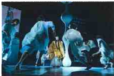
東京キャラバン～プロローグ～（2015年）

詳細は、公式Webサイト（ http://tokyocaravan.jp/ ）にてご覧いただけます。