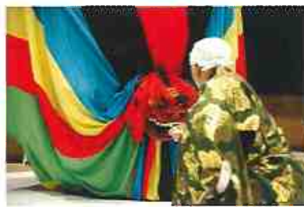
東京キャラバン in 東北（2016年）