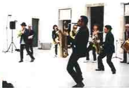
東京キャラバン in RIO（2016年）