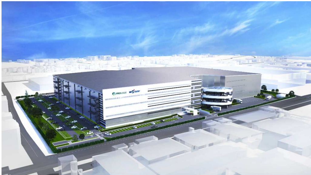
「MFLP プロロジスパーク川越」完成イメージ

プロロジスは、物流不動産のリーディング・グローバル企業であり、国内でも最多の物流施設の開発実績を持つ。一方、三井不動産は、不動産業界国内最大手の総合デベロッパーとして幅広い顧客ネットワークを有する。双方の強みを活かし、共同事業の可能性を探る過程で、このたび「MFLP プロロジスパーク川越」の開発が実現した。双方のノウハウを結集し、より先進的で質の高い物流施設の提供をめざす。