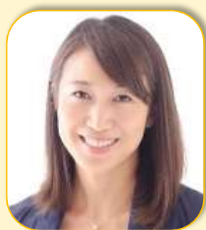
ふじまる みちよ 藤丸 真世さん アテネオリンピック シンクロナイズドスイミングチーム 銀メダリスト