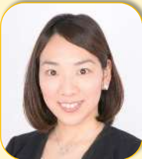
つみき じゆり 巽 樹理さん シドニー・アテネオリンピック シンクロナイズドスイミングチーム 銀メダリスト