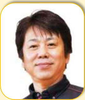
ねず しんじ 根木 慎志さん シドニーパラリンピック 車椅子バスケットボール 日本代表チームキャプテン