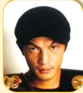
さとう おさむ 佐藤 修さん 第22代WBA世界 スーパーバンタム級王者