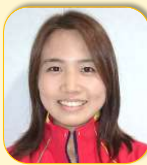
ひらの さやか 平野 早矢香さん ロンドンオリンピック 卓球女子団体 銀メダリスト