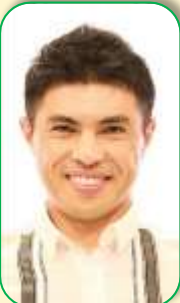
こじま よしおさん 小島 よしおさん お笑い芸人