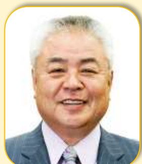
やなぎもと しゅういち 柳本 晶一さん アテネ・北京オリンピック バレーボール 全日本女子チーム監督