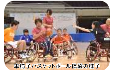
車椅子バスケットボール体験の様子

公式ホームページ https://www.sports-dream2017.com/