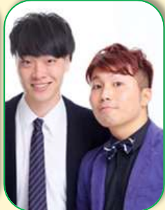
アメリカンコミクス お笑い芸人