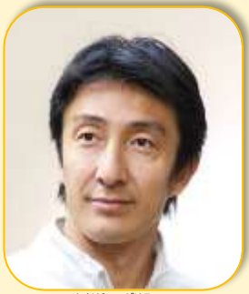
あさはら のがはる 朝原 宣治さん 北京オリンピック 4×100mリレー 銅メダリスト