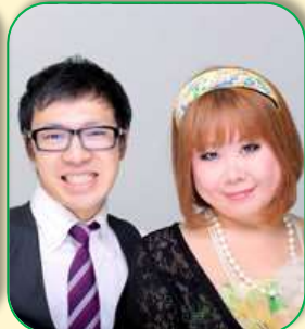
ハニートラップ お笑い芸人