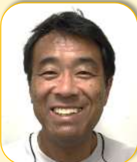
しんたく まさなり 新宅 雅也さん ソウルオリンピックマラソン日本代表 1986年アジア競技大会 陸上10000m 金メダリスト