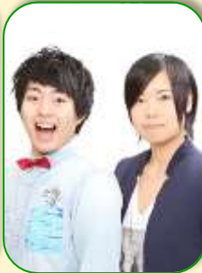
しんせん 新鮮なたまご お笑い芸人