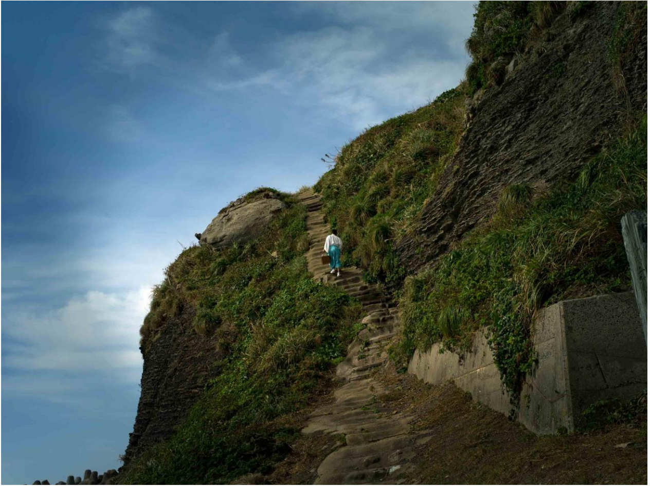
沖津宮へ続く参道