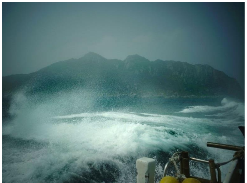
激しく揺れる船の舳先に立って撮影した命がけの一枚