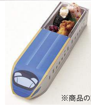
※商品の詳細は P5 へ