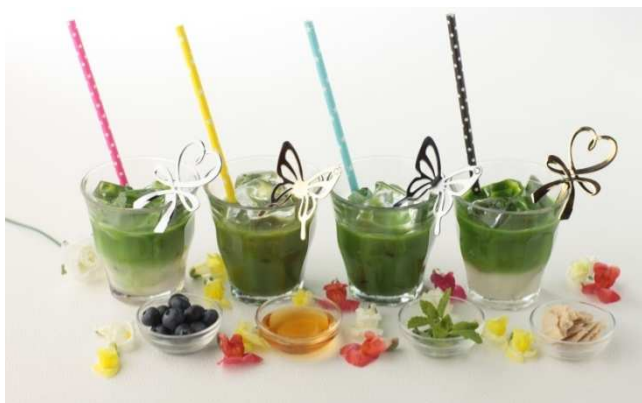
「Kale de Kale」を使ったイベント限定の特別メニュー