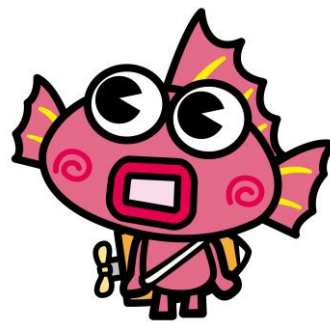
ボートレース鳴門キャラクター「なるちゃん」

＝本件に関するお問い合わせ＝ 一般財団法人BOATRACE振興会 広報部 佐々木 （平日9：00～17：00） Tel：03-3451-0501 Fax：03-3451-0429