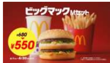
NA「6 月 20 日までビッグマックセットが 550 円」