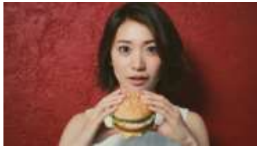
大島さん「実はずっと好きだったの」