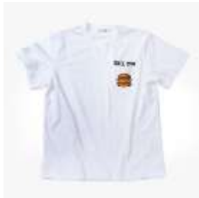
ユニセックス T シャツ