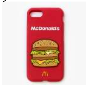
スマホケース (iPhone7 専用)