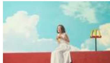
大島さん「大好きー！」