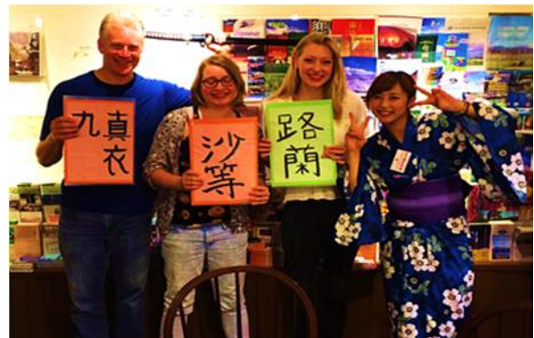
昨年の参加学生の中には、このプロジェクトがきっかけでホテル業界に興味を持ち、有名ホテルの内定をとった学生も。