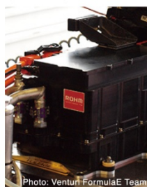
インバータへのSiCパワーデバイスの効果

ロームはFIAフォーミュラE選手権に参戦するヴェンチュリー・フォーミュラEチーム(Venturi Formula e Team)のオフィシャルテクノロジーパートナーとなり、マシン駆動の中核を担うインバータ部に世界最先端のパワー半導体 SiC パワーデバイスを提供し、マシンの小型・軽量化、高効率化をサポートしています。