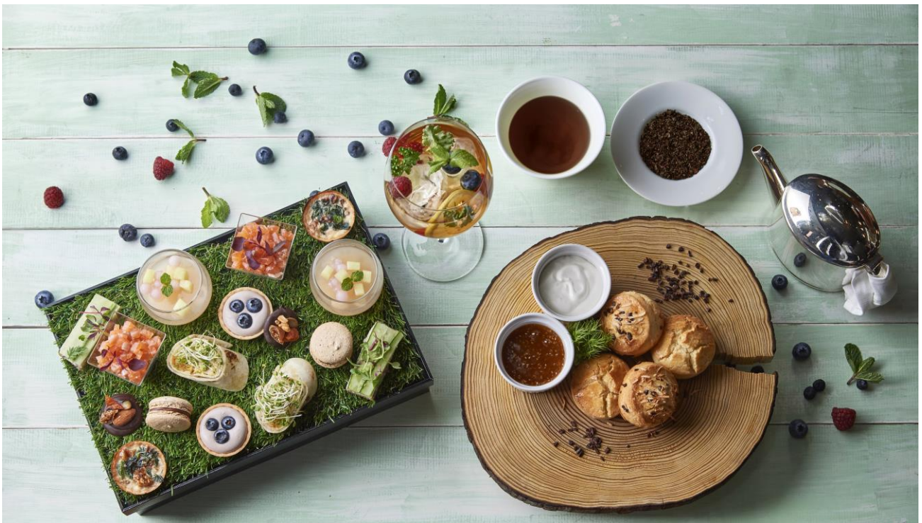
サマースーパーフード アフタヌーンティー

都会の喧騒にそびえ立つダイナミックなラグジュアリーホテル、グランド ハイアット 東京(東京都港区、総支配人: スティーブ ディワイヤ)は、アサイーやココナッツ、チアシード、ゴジベリー、クルミなどのスーパーフードをはじめ、美容と健康によいといわれる食材をふんだんに取り入れたヘルシー&ビューティーな「サマースーパーフードアフタヌーンティー」をご用意いたします。ハワイや沖縄のヘルシーティーとともに、グリーンを基調にしたデコレーションのアフタヌーンティで、夏の紫外線や冷房にさらされた身体と心に癒しのひとときをお過ごしください。店内の他、爽やかな空間がお楽しみいただけるテラス席でもお召し上がりいただけます。