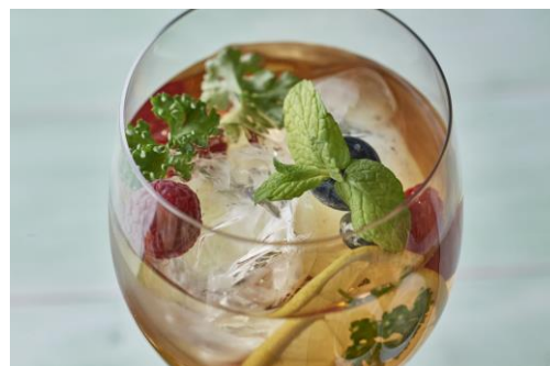
ママキティー(イメージ)