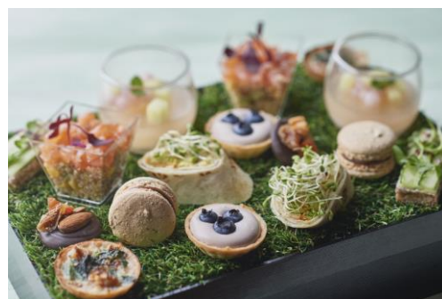
サマースーパーフード アフタヌーンティー (イメージ)