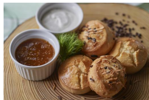
ココナッツとカカオニブのスコーン とプレーンスコーン ヨーグルトホイップと アプリコット&チアシードジャム